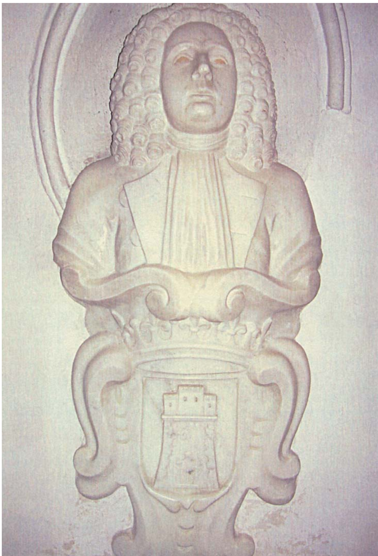
Stele funeraria di uno studente di Giurisprudenza - Chiesa del Rosario (Catanzaro)